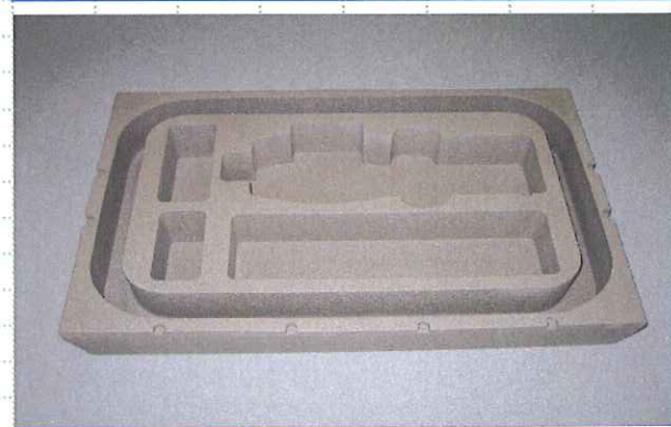
計測機器セット抜型ウレタン素材

※本製品は品質改良の為、仕様 デザインを 予告なく変更する場合があります。 ※安全に関するご注意 ご使用前に取り扱い説明書をご覧ください。