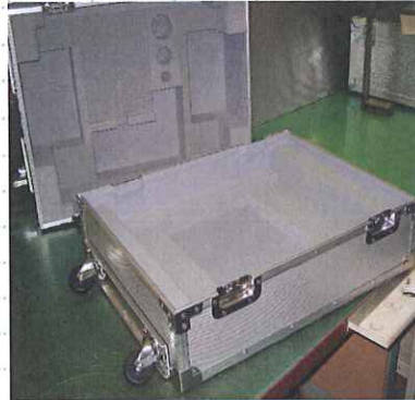
医療機器用ケース