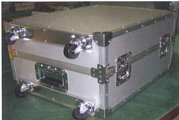
運搬補強キャスターケース