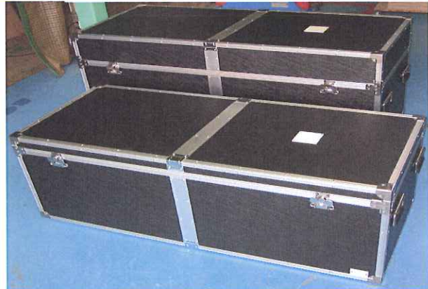
音響機器用アルミケース