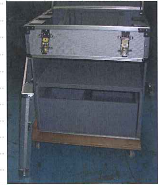
ラックマウントケース